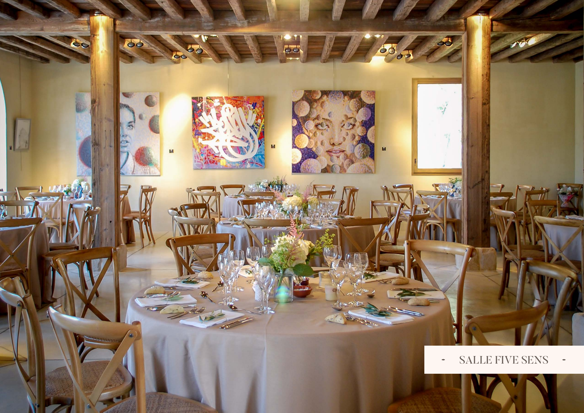
- SALLE FIVE SENS -