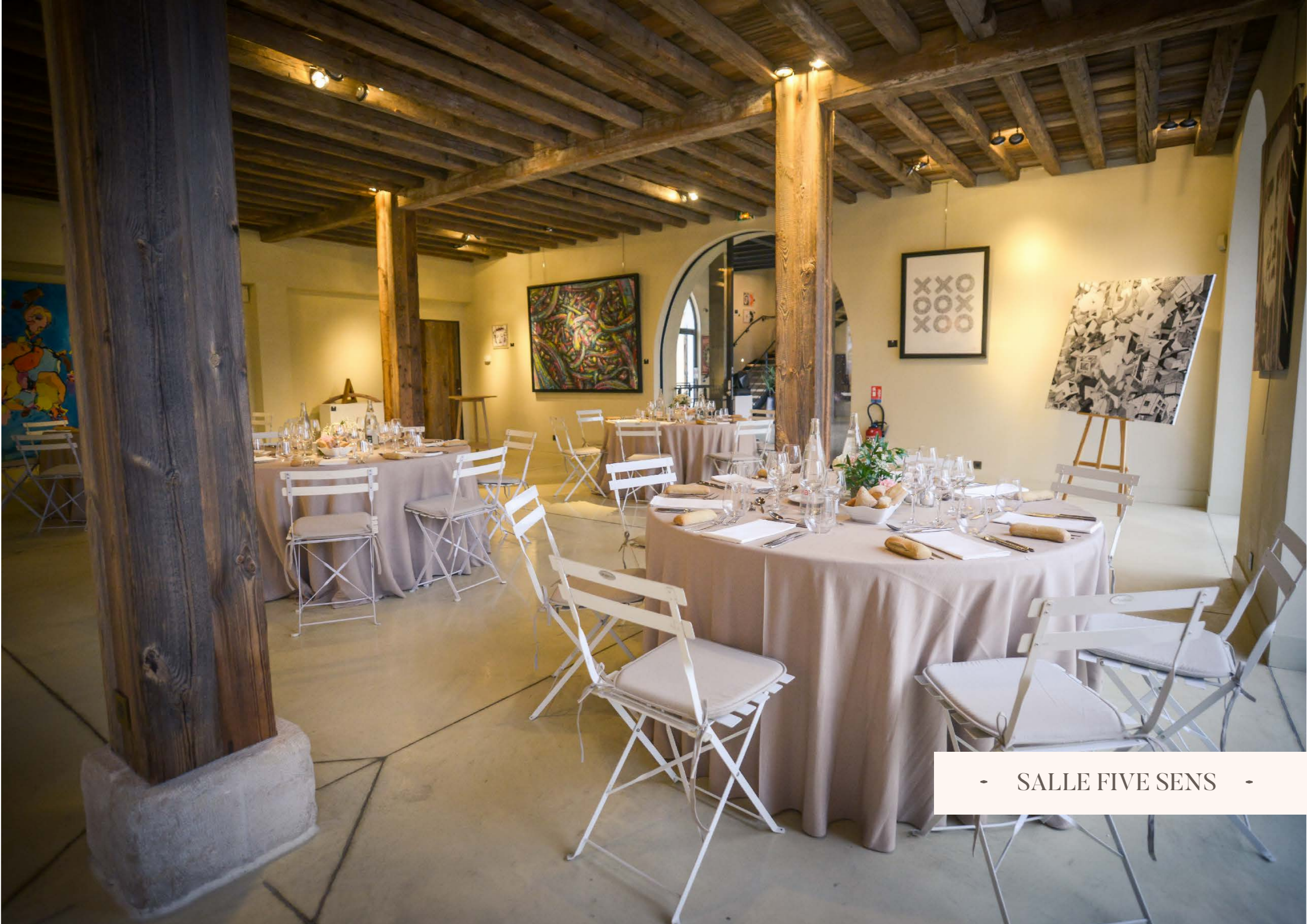
- SALLE FIVE SENS -